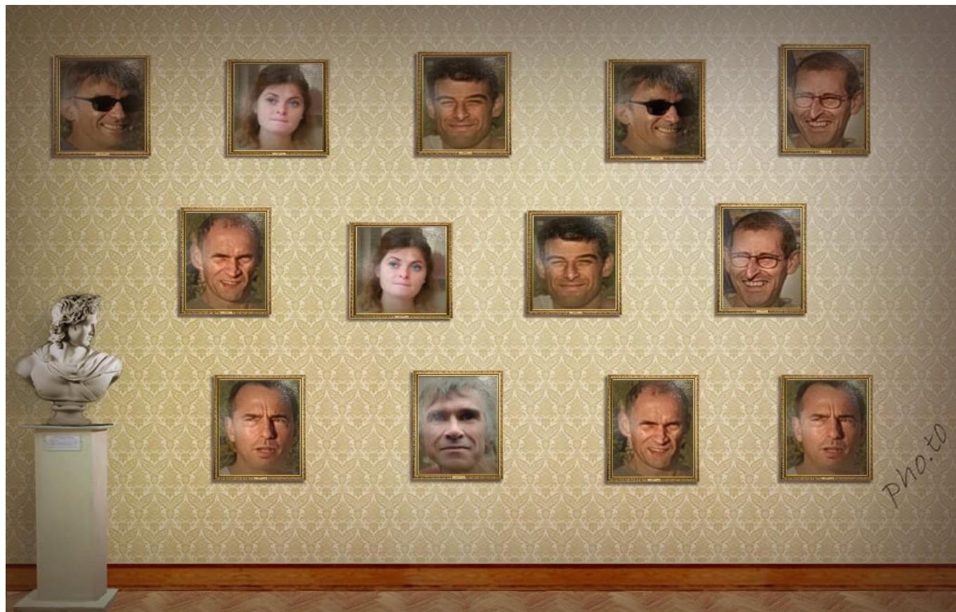
(Musée des beaux-arts de Valence, dimanche après-midi.)